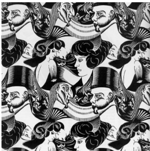
Escher, Otto teste , 1922

Questi canali comunicativi sussidiari devono rimanere tali e non possono sostituire la comunicazione anche empatica fra paziente e terapeuta, insostituibile nella costruzione di ogni rapporto di cura.