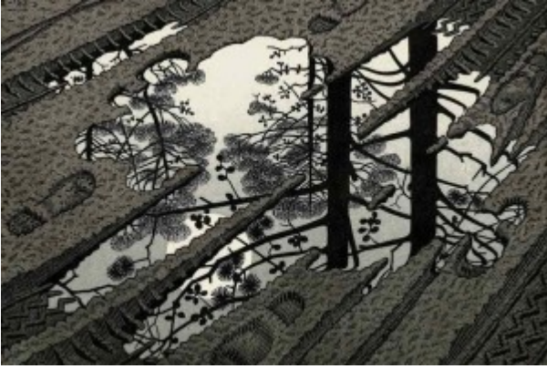
Escher, Superficie increspata , 1950