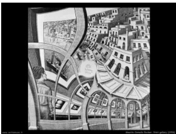
Escher, Convesso e concavo , 1955

In questi momenti siamo stati “costretti” a come pensare/vivere anche il tempo in maniera diversa! Il tempo attuale è un tempo “sospeso”, “forzato”, “contingentato”, “compresso”, che sta influenzando le nostre condizioni di vita, Saremo pronti ad eventuali aggiustamenti (forse cambiamenti)? È difficile rispondere se non accodandosi a valutazioni “comode” basate sul “tanto tutto tornerà come prima” (passato il temporale si chiudono gli ombrelli). Stiamo facendo i conti su quanto sia impossibile desiderare il cambiamento senza cambiare , stando fermi col pensiero/comportamento e sperando solo il ritorno alla nostra normalità rassicurante, salvo poi ricominciare a lamentarsi del traffico della vita accelerata, delle “bombe d’acqua” etc! Per riflettere in modo diverso potremmo iniziare a pensare questo periodo come esperienza di tempo vissuto , non solo subito , marcato dal nostro orologio interno. Lo ricorda Henry Bergson [17] quando nel suo Memoria e tempo (1889) evidenziava la differenza fra il tempo vissuto (quello interiore) e il tempo cronometrato (quello sociale).