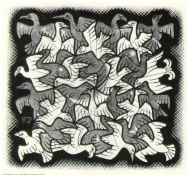
Escher, Sole e luna , 1948

In sintesi, penso che bisognerà creare nuovi momenti di ascolto di gruppo in cui sia possibile raccontarci l'esperienza comune e la sofferenza individuale.