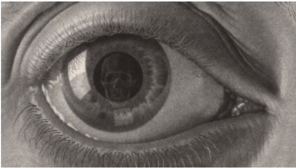
Escher, Occhio , 1946