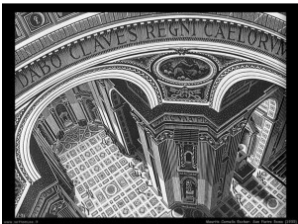
Escher, san Pietro , 1935

Dipenderà dalle risorse individuali messe in campo (e soprattutto quelle rimaste!) in che forma leggera / pesante sarà toccato ognuno di noi e da quanto la società sarà capace di creare “ammortizzatori” per lenire indubbi stati di sofferenza non solo psichica. L’attentato alle condizioni di vita attuali per certi versi ci ha riportato indietro nel corso del tempo a quel senso di «precarietà dell’esserci e al rischio di non esserci» descritta negli anni cinquanta da Ernesto de Martino [12] come “crisi della presenza” e ripresa poi anche da Ulrich Beck (1986) nel suo La società del rischio [13].